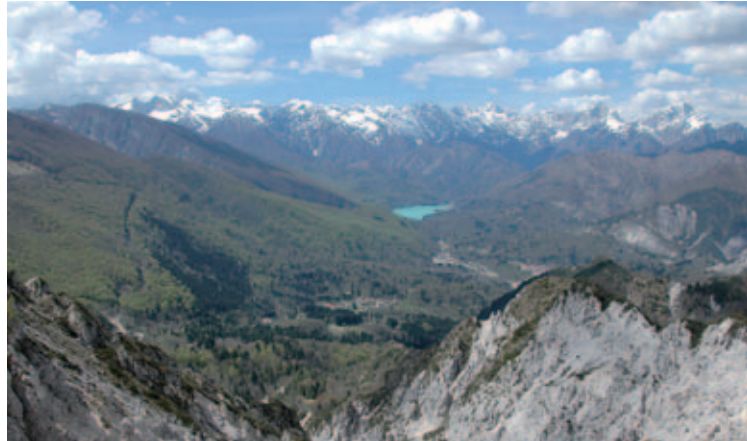
Panorama dal sentiero