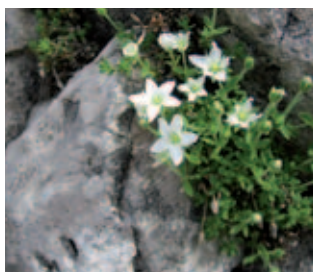
Arenaria di Huter

From the pass, you follow the ridge, first towards the west and then in a north-easterly direction; along this last part of the route, it is necessary to climb up a rocky step a few metres in height (iron cable). There is a stunning view from the summit: the plain and sea to the south, the Mount Cavallo group to the west and to the north the other peaks in the Park.