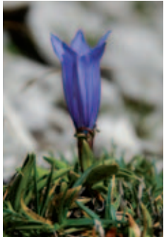
Genziana di Froelich

Dalla località Pian Melùth (nei pressi del Rifugio Pordenone, raggiungibile dall'abitato di Cimolais lungo la strada della Val Cimoliana) l'itinerario ha inizio imboccando l'ampia e ghiaiosa valle del Sciol de Mont . Si risale fino a piegare a destra (attraversamento del rio con acqua) e penetrare nel caratteristico bosco di abeti e larici della Ronsciada , frequentato dal gallo cedrone, fino a raggiungere il pascolo dell'omonima casera (ricovero in legno, aperto). Il sentiero prosegue a raggiungere la Forcella della Lama, eccezionale punto di osservazione paesaggistico (panorama dolomitico verso gli Spalti di Toro ed i Monfalconi) e faunistico (finestra sulla prateria animata dalla presenza di marmotte e camosci). Superato un altipiano ( Pian de la Casara Vescia ) ed un'ultima forcella (Forcella Savalòns), dove è possibile osservare la fioritura tardo estiva dell'endemismo floristico genziana di Froelich, il sentiero scende in breve alla Casera Bregolina Grande (aperto vano ricovero). Si prosegue sempre in discesa superando l'ampio pascolo e il bosco d'abete fino a raggiungere ed attraversare un rio ( Sciol de la Stua ).