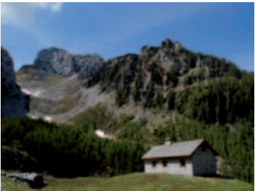
Casera Bregolina piccola