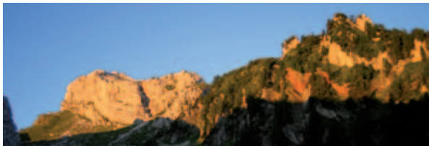
Alba sugli Ampes