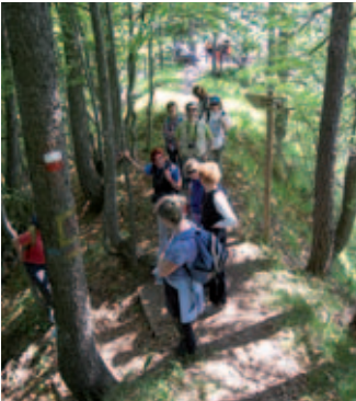
Sentiero del Von

From the carpark at Santaviela (opposite the Varmost chair lift station), walk up the valley forest path following the Tagliamento river upstream to the Davaras bridge, where you take the road for the Giau Refuge. You will come to a characteristic 19th century lime kiln, recently restored. Shortly after, in the locality of Borsaia, you cross a stream and walk up the Lavinal dal Ors valley, along the cartroad (CAI - Italian Alpine Club - trail 367) to the last large weir, which you cross above the start of the Truoi dal Von trail. Climbing up the slope, you will find the remains of a former charcoal kiln and then come to the first panoramic point, with sweeping views of the Lavinal scree