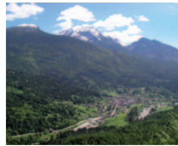
Panorama di Forni di Sopra