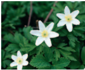
Anemone dei boschi