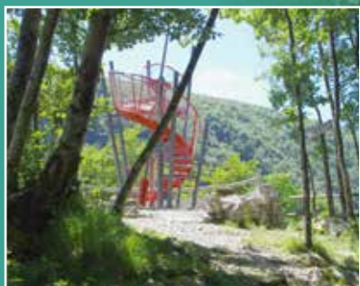
Belvedere / Lookout