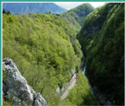
Panorama Forra del Cellina / Cellina gorge panorama