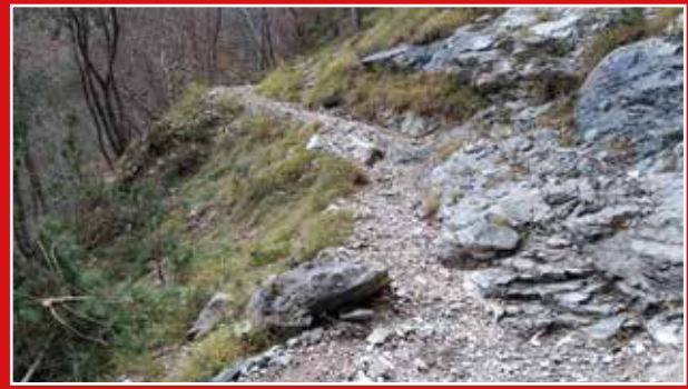
Sentiero bosco di Lodina / Lodina forest path

Dal parcheggio presso il Ponte Compol, raggiungibile da Cimolais seguendo la strada della Val Cimoliana, si imbecca il sentiero che sale attraverso il bosco di Lodina fino a raggiungere il pascolo e l'omonima Casera (ricovero). Da quest'ultima si prosegue risalendo il pascolo e, oltrepassati i ruderi di un'ulteriore casera (Bergon) si perviene alla Forcella Lodina. Da qui il sentiero va a immettersi nell'ampio vallone di origine carsica della Busa dei Vediei, caratterizzato dalla presenza di dossi, doline e inghiottitoi diffusi. Oltrepassato questo ampio altopiano, la traccia prende a salire e a raggiungere la cresta delle Cime Centenere, ne percorre una parte (difficoltà alpinistiche) e successivamente scende leggermente per pervenire alla Forcella del Duranno, situata ai piedi dell'omonima cima, caratteristica per l'imponente forma piramidale. Il percorso prosegue successivamente discendendo il versante opposto, inizialmente per rocce articolate (difficoltà alpinistiche) fino alla loro base, da cui si prosegue per traccia su ghiaioni prima e lungo una boscaglia di pino mugo poi, fino a pervenire al Rifugio Maniago. Dal Rifugio si segue il sentiero, che attraversa i caratteristici boschi della Val Zemola, per raggiungere il fondovalle e il Rifugio Casera Mela (parcheggio).