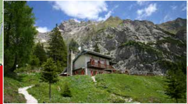
Rifugio Maniago / Maniago Alpine Hut