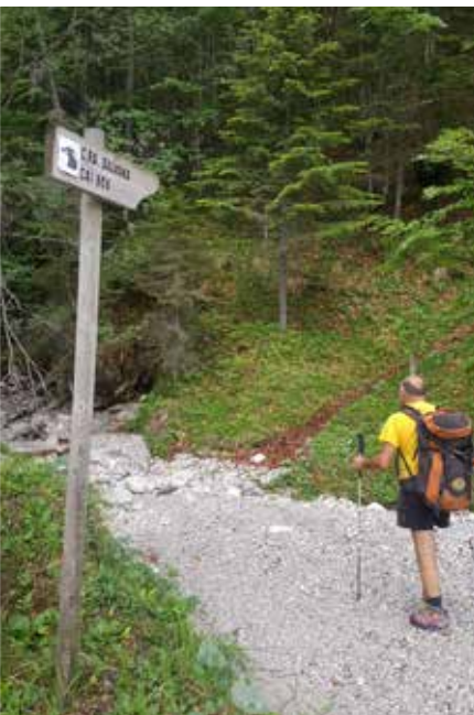
Sentiero Casera Galvana / Casera Galvana path